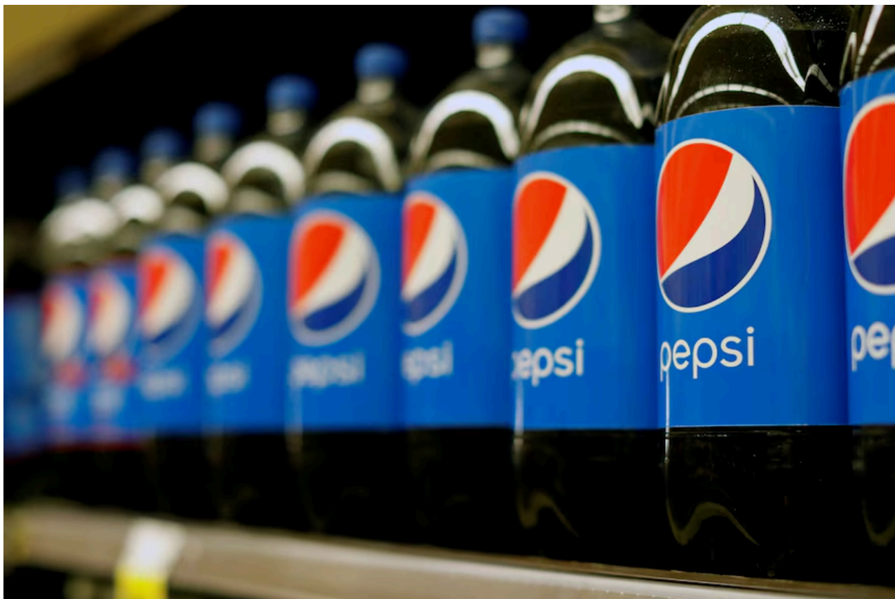
百事可樂正爭議一項稅務法案。

ATO指控百事可樂喺2018同2019財政年度同前施威普澳洲公司，隨後係朝日飲品公司嘅交易， 欠咗幾百萬嘅版稅預扣稅同轉移利潤稅 。