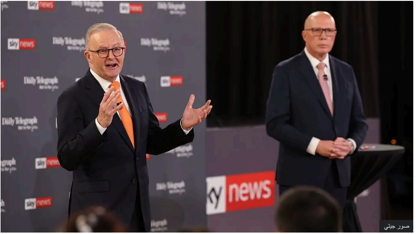
تعهد كل من أنتوني ألبانيز (يسار) وبيتر داتون بمعالجة أزمة الإسكان في حملتهما الانتخابية

وتتمثل السياسة الأساسية للائتلاف في دعم القدرة على تحمل تكاليف الإسكان في الحد من الهجرة، وتقليص عدد الطلاب الدوليين، وتنفيذ حظر لمدة عامين على الاستثمار الأجنبي في العقارات القائمة