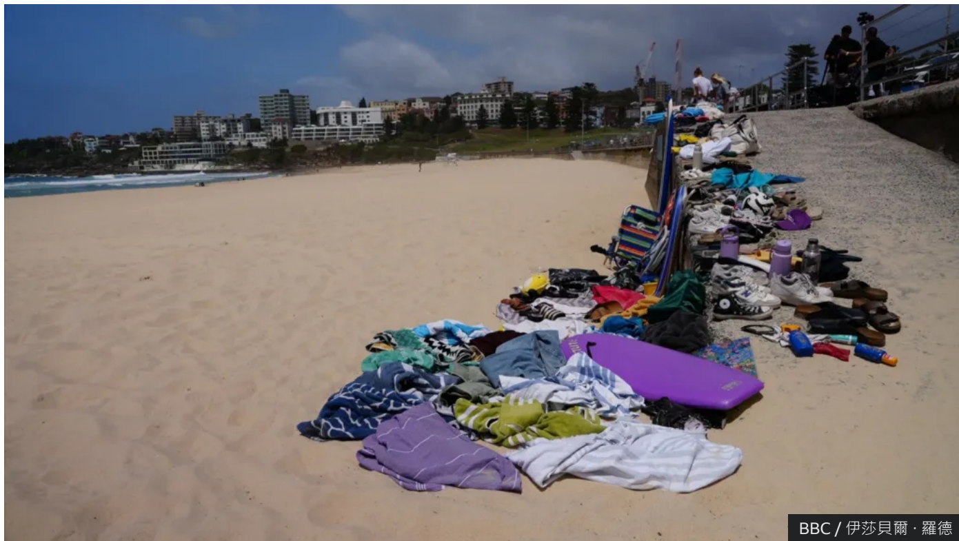
星期一喺邦迪海灘上，有證據顯示夜晚嘅混亂

「我識呢啲人。佢哋每朝起身都係為咗保護澳洲人嘅安全。佢哋只係想做呢樣嘢。但係佢哋失敗咗，而佢哋今日會比任何人都清楚。」